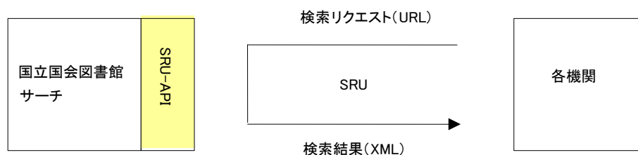
図 3-1 SRU 提供インタフェースの概要

SRU（Search/Retrieve Via URL）により、外部機関等が本サービスを検索し、結果を取得するためのインタフェースである。