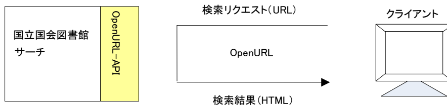
図 5-1 OpenURL 提供インタフェースの概要

OpenURL により、外部機関等が 本サービス を検索し、結果を取得するためのインタフェースである。