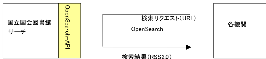
図 4-1 OpenSearch 提供インタフェースの概要

OpenSearch により、外部機関等が本サービスを検索し、結果を取得するためのインタフェースである。