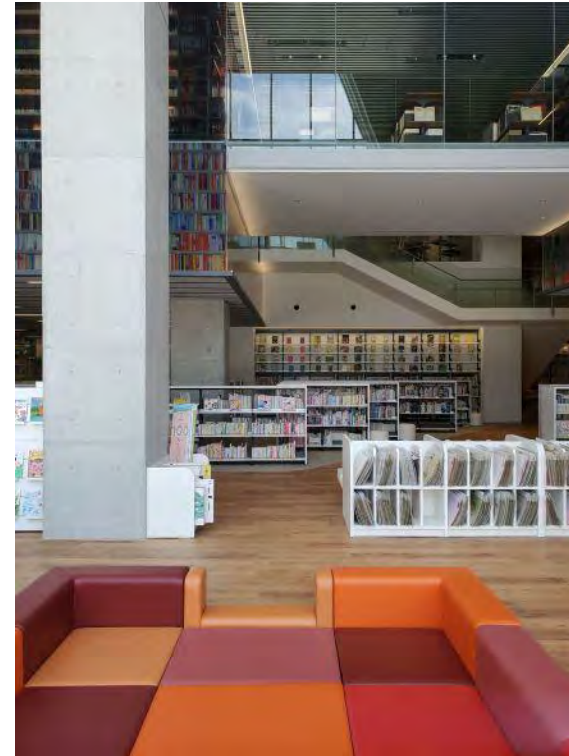
2階にぎやかエリア